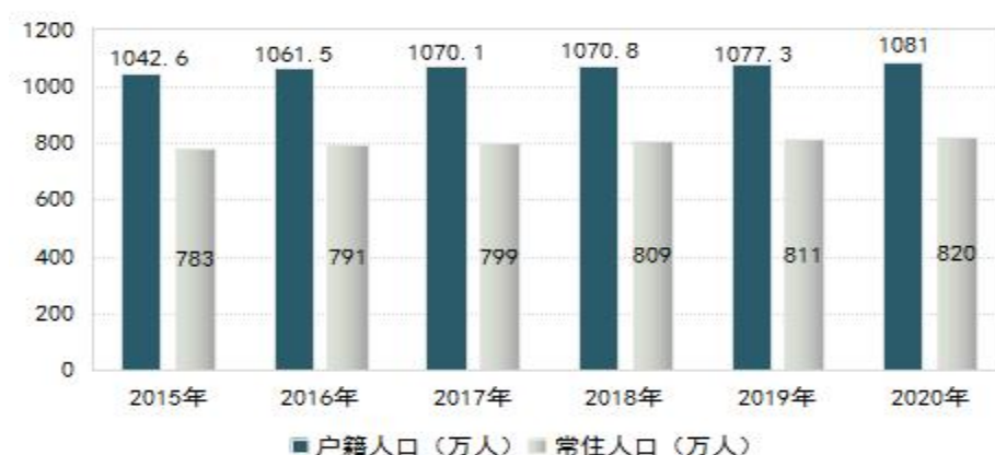
图 1 “十三五”时期阜阳市人口增长趋势

1.人口总量保持稳定。“十三五”时期，全市贯彻落实全面两孩政策，改革完善计划生育服务管理，人口自然增长保持平稳。五年累计出生人口 69.9 万人，户籍人口达到 1081.0 万人，与 2015 年 1042.6 万人相比增加了 38.4 万人。常住人口 820.0 万人，与 2015 年 783.0 万人相比增加了 37.0 万人，比第六次全国人口普查数据增加 60.0 万人，增长 7.9%，年均增长率为 7.6‰，人口总量和十年来人口增量均居全省第二位。